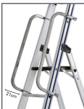
Corrimano (a richiesta) Realizzato in tubo quadro di alluminio da mm 25x25 da cm 77. Può essere fornito singolo o a coppia cod. A50CORR67