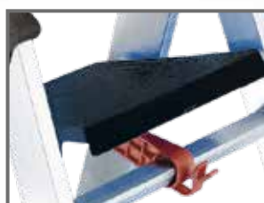
Piattaforma in polipropilene con fermo di sicurezza